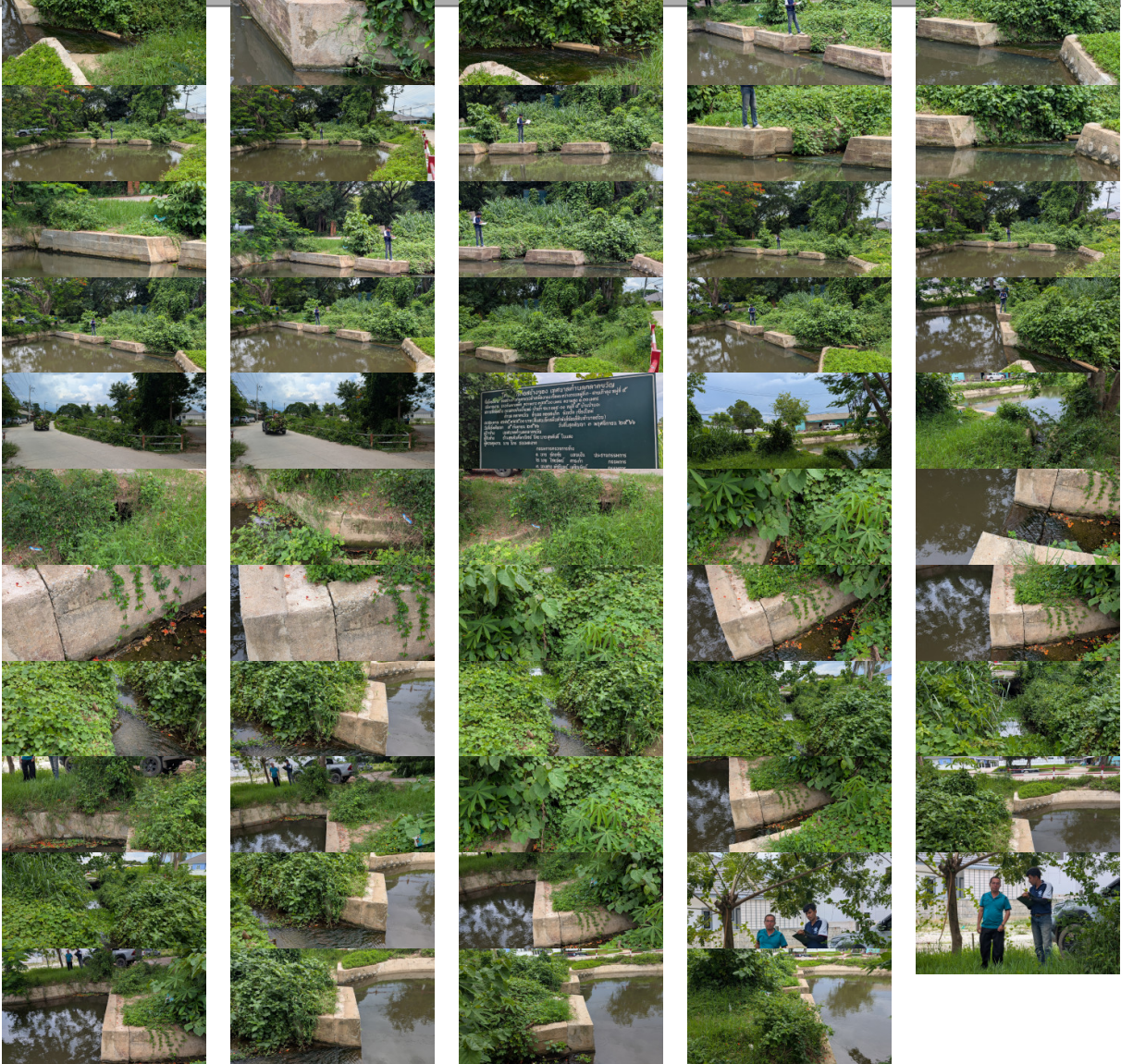
4 ส่วน ท้ายน้ำ