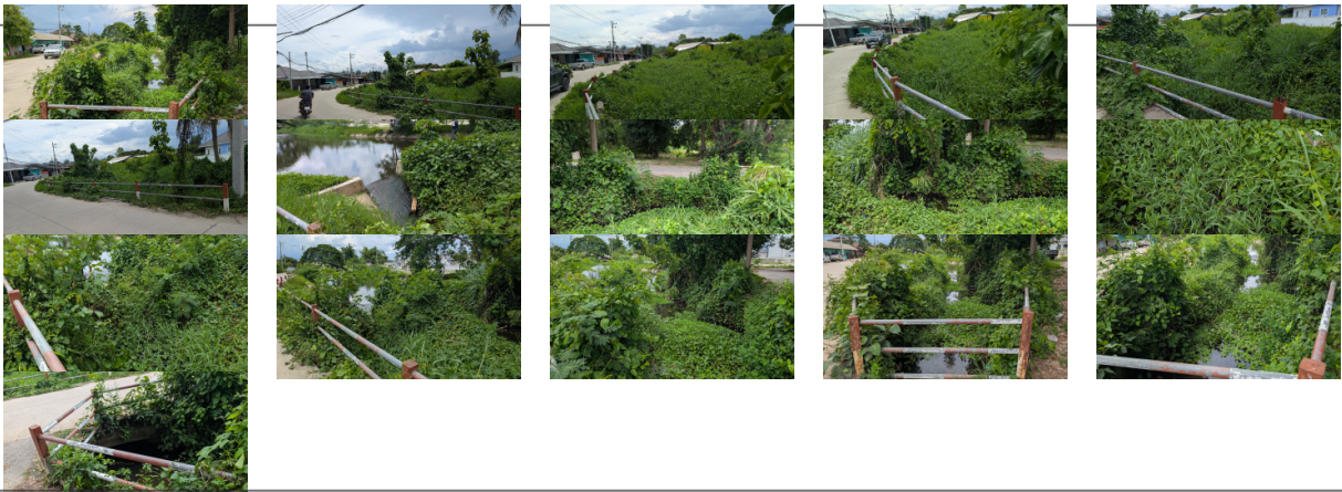
5. ส่วน Protection ท้ายน้ำ