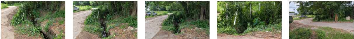
6. ระบบส่งน้ำ