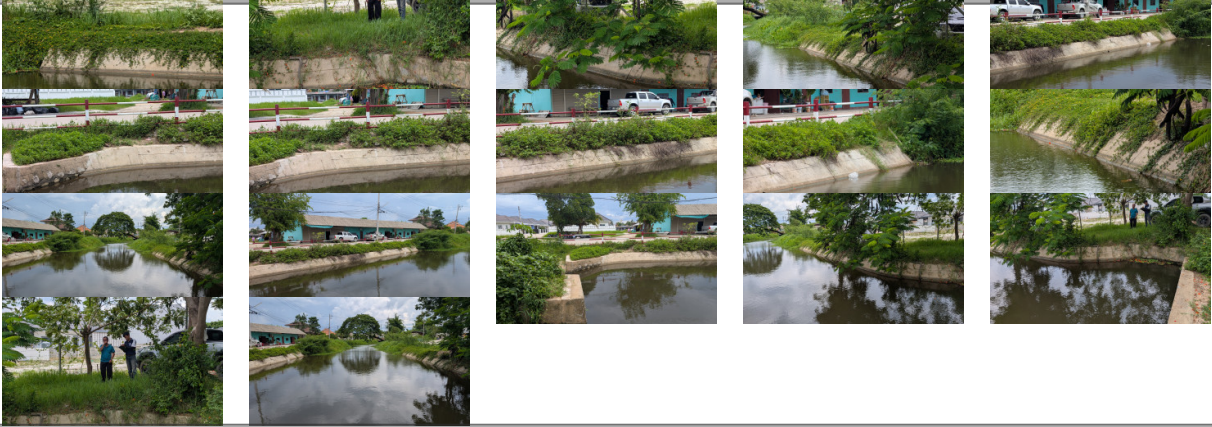
3 ส่วน ดงเดิม